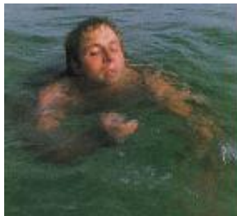
Слика 7. Слаб и уморан пливач

Карактеристике слабог и уморног пливача (слика 7):