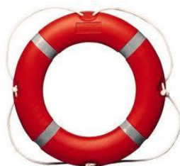
Слика 24. Спасилачки круг

Сличан је спасилачкој лопти. Уже је истих димензија. Ово средство се користи са обале или пловног објекта. Кругом (слика 24) би требало да рукује искусан спасилац јер неправилном употребом можемо нанети повреде дављенику, с обзиром да се круг прави од тежег и чвршћег материјала.