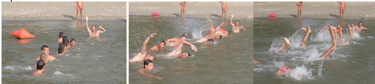
Слика 62. Формација спасилаца за предрагу подручја

Приликом потраге у води спасиоци су поређани у врсту са међусобном раздаљином на дохват руке (слика 62). Врста се креће на команду једног спасиоца који се налази на почетку врсте. Спасиоци роне на команду руководећег спасиоца и приликом потраге крећу се три корака (завеслаја) у напред и два корака (завеслаја) у назад. На тај начин се обезбеђује сигурна претрага терена.