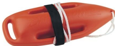
Слика 27. Спасилачка бова

Слична туби по начину коришћења, са том разликом да се њоме не може обухватити дављеник, него се приступа тако да се прво пружи дављенику, а потом се бова мора обема рукама ухватити испод његових руку и тако га транспортовати на сигурно. Бова (слика 27) може да држи на површини три па чак и четири лакше особе. Најчешће се користи на океанима и морима где су таласи велики.