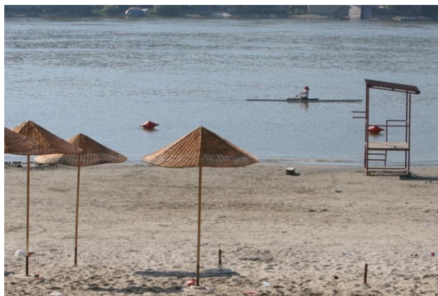
Слика 57. Слабо посећена плажа

Конкретно за плажу „Стари град“ минималан број спасилаца је четири у смени. Три спасиоца седе на осматрачким позицијама, а четврти спасилац је мобилан и допушта замене спасиоцима на позицијама. Четврти спасилац поред обавезе да врши замене, може имати и обавезу да дужи спасилачки чамац у току смене. Овакав начин рада задовољава форму коју прописује члан 10. став 1. тачка 14 Правилника за обављање спортских активности и делатности (Сл. Гласник РС 30/99). Слаб ниво посећености подразумева да тобоган који се налази у оквиру плаже у том режиму рада није у функцији.