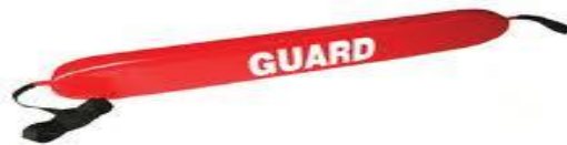
Слика 26. Спасилачка туба (торпедо)

Израђена од непромочивог сунђерастог материјала који би требао по својим карактеристикама да одржи два човека на површини. Туба (слика 26) са једне стране има алке, а са друге карабињер куку којом се туба фиксира на груди дављеника. Туба је спојена за појас који спасилац пребацује преко рамена. Коришћење овог спасилачког средства је лако и ефикасно, под условом да је дављеник у свесном стању. Када се дође до дављеника, додаје му се торпедо који он хвата, затим се ставља око њега и у зависности од његовог стања плива одређеним стилем до обале. Ово средство се може користити како на отвореним тако и на затвореним водама.