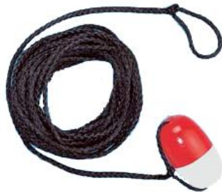
Слика 23. Спасилачка лопта

Лопта у мрежи са канапом (25 м дужине и 5-10 мм дебљине). Спасилачка лопта (слика 23) се лако користи, практична је и прецизна. Лопта се баца на дохват руке дављеника или што даље преко њега, после чега се малом корекцијом са обале довлачи до дављеника, након чега се дављеник хвата за лопту и извлачи на обалу.