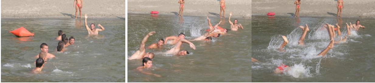
Слика 62. Формација спасилаца за предрагу подручја

Приликом потраге у води спасиоци су поређани у врсту са међусобном раздаљином на дохват руке (слика 62). Врста се креће на команду једног спасиоца који се налази на почетку врсте. Спасиоци роне на команду руководећег спасиоца и приликом потраге крећу се три корака (завеслаја) у напред и два корака (завеслаја) у назад. На тај начин се обезбеђује сигурна претрага терена.