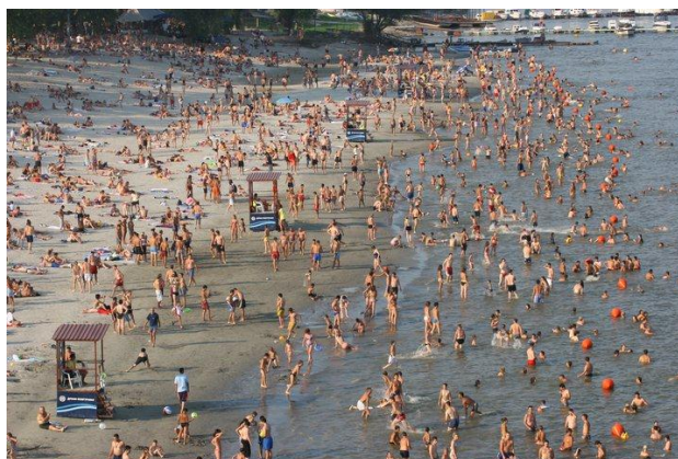
Слика 60. Прелазак капацитета плаже, купачи ван безбедне зоне

Екстремним условима рада се може сматрати и организовање неког ванредног догађаја који узрокује повећан број посетилаца и додатно оптерећује капацитет плаже, што се може окарактерисати и као превелика посећеност или пробијање капацитета плаже. Ситуације преоптерећења плаже је немогуће избећи. Безбедна обележена зона купања стално мења свој капацитет у односу на водостај Саве, па је и то немогуће прецизно одредити. Чињеница је да у једном тренутку уз повољну комбинацију са временским условим број купача прелази капацитет обележене зоне, односно безбедне зоне купања (слика 60). У таквој ситуацији физички је немоће поставити све купаче у безбедну зону, а један број купача ван те зоне се излаже опасности.