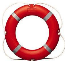
Слика 24. Спасилачки круг

Сличан је спасилачкој лопти. Уже је истих димензија. Ово средство се користи са обале или пловног објекта. Кругом (слика 24) би требало да рукује искусан спасилац јер неправилном употребом можемо нанети повреде дављенику, с обзиром да се круг прави од тежег и чвршћег материјала.