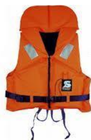
Слика 29. Спасилачки појас

Саставни део опреме на пловним објектима. Појас (слика 29) је испуњен непромочним сунђером, стиропором или ваздухом који може човека да одржи на површини. Појас је одлично превентивно средство и са његовом употребом би требало да буду упознати сви они који бораве (раде) на води или у њеној близини.