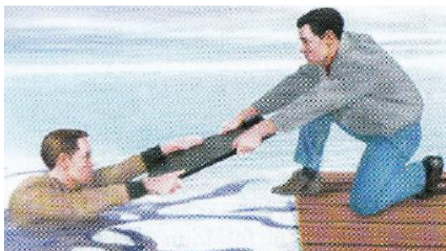
Слика 22. Коришћење приручног средства у спасавању (даска)

Приручна средства су сва она која се у датом тренутку нађу на месту несреће, а могу послужити за спасавање (дугачак штап, дрво, лопта, канап, мердевине) (слика 22).