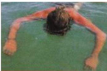
Слика 4. Пливач у несвести

Карактеристике несвесног пливача (слика 4):