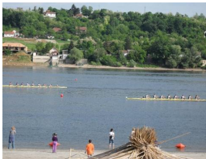
Слика . Спортско такмичење на отвореној води

Спортски догађаји на отвореним водама су увек високог ризика у погледу безбедности. Спасилачка служба мора благовремено добити све податке од организатора о спортском догађају који се организује, предвидети могуће инциденте и унапред се припреми како ће реаговати у њима. Ти подаци се односе на: