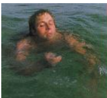
Слика 7. Слаб и уморан пливач

Карактеристике слабог и уморног пливача (слика 7):