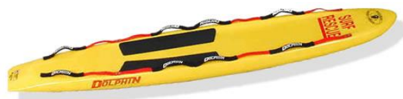
Слика 28. Спасилачка даска

Слична дасци за једрење, са тим да нема јарбол и кормиларно пераје. Даска (слика 28) је веома ефикасно и брзо средство. Користи се када је удаљеност од обале до места несреће велика, па је потребно што брже стићи до дављеника, а са што мање напора. Дављеник се лако може поставити на даску, спасилац легне на даску иза дављеника, весла рукама и тако врши транспорт.