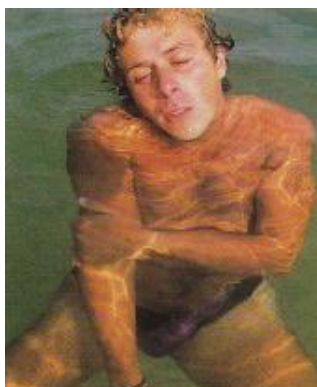
Слика 6. Повређени пливач

Карактеристике повређеног пливача (слика 6):