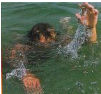
Слика 5. Непливач